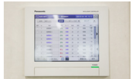
インテリジェントコントローラーでビル全体を集中制御

まだ改築後1年経っていないため、昨年との消費電力の比較はされていませんが、省エネ性と快適性には大変満足しています。