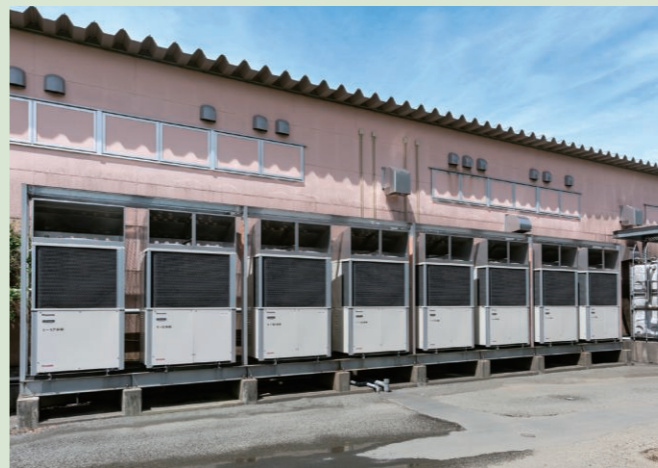
▲スーパーセンターの外に設置された室外機 U-GH280U1DR U-GH560U1DR

省エネ性を重視したガスヒートポンプエアコン導入で、リアル店舗の存在価値向上に貢献させていただきます。