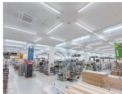
▲ホームセンターエリア

食品・飲料を扱っているエリアと雑貨を扱っているエリア、日配品(生鮮品)エリアに分かれており、開放感があり明るい雰囲気のお店となっています。