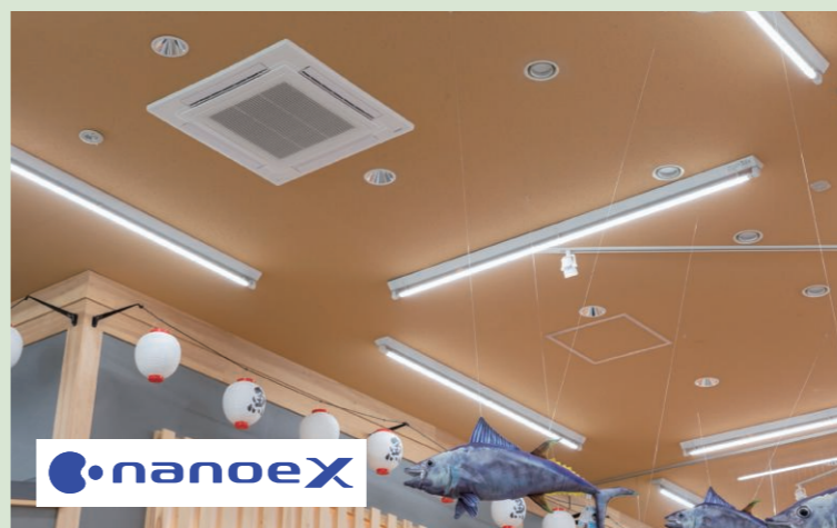
▲ナノイーX機能搭載の4方向天井カセット形を設置。