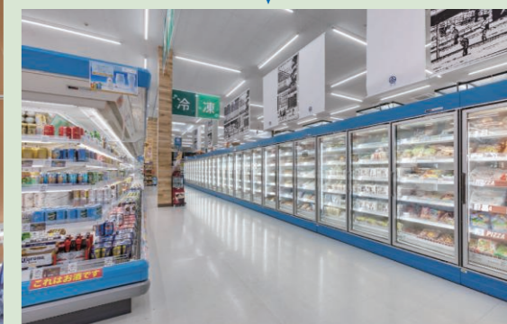
▲冷凍食品の需要が伸びている昨今、買いだめを見込み品揃えを充実。