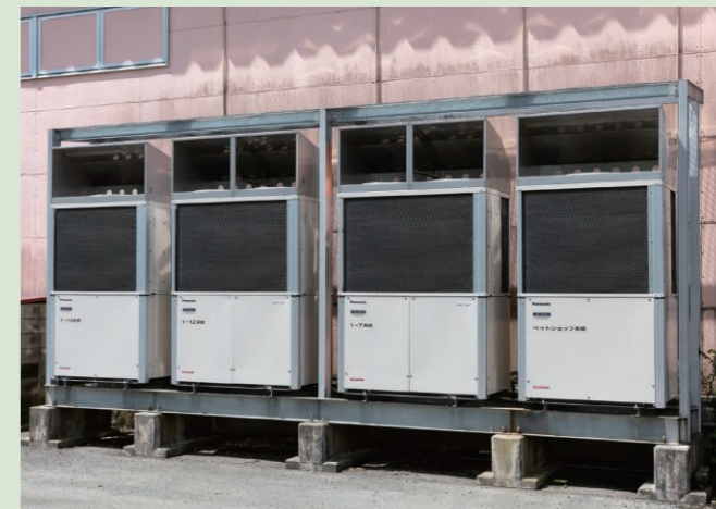
▲スーパーセンターの外に設置された室外機 U-GH280U1DR U-GH560U1DR