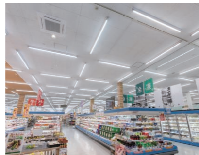
▲食品・飲料エリア