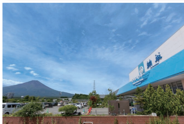
▲外観 (駐車場から雄大な富士山を一望できるロケーション)

■所在地 山梨県南都留郡富士河口湖町船津4910 ■設立 2018年7月11日リニューアルオープン