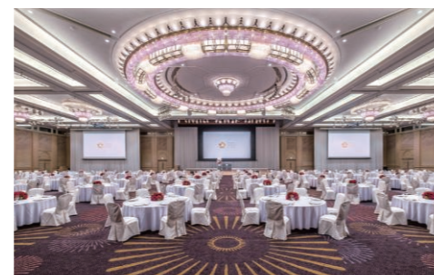
▲サミットホール(シーガイアコンベンションセンター)