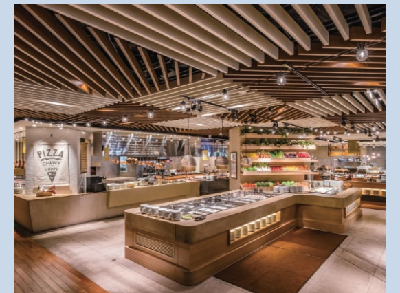
▲ガーデンビュッフェ「パインテラス」(シェラトン・グランデ・オーシャンリゾート)