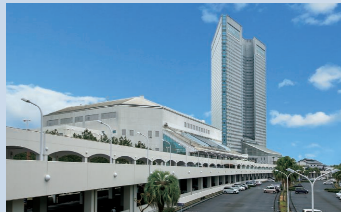
▲シーガイアコンベンションセンター、シェラトン・グランデ・オーシャンリゾート、松泉宮(温泉施設)へ熱供給。

また、併設されているインバーターボイラーとナチュラルチラーによるエネルギーのベストミックスによって、さらに効率の良いエネルギー活用を実現し、「シェラトン・グランデ・オーシャンリゾート」「シーガイアコンベンションセンター」「松泉宮(温泉施設)」への効率的な熱供給を行っています。