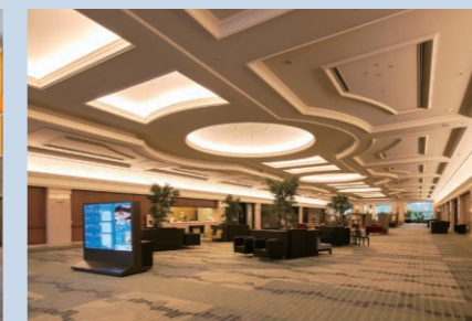
▲ロビー(シーガイアコンベンションセンター)