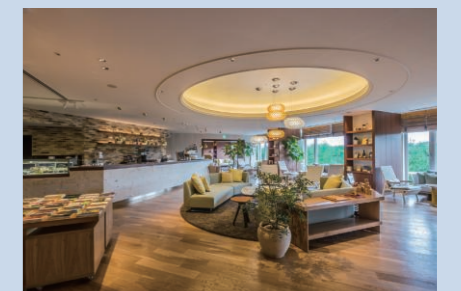
▲風待ちテラス(シェラトン・グランデ・オーシャンリゾート)