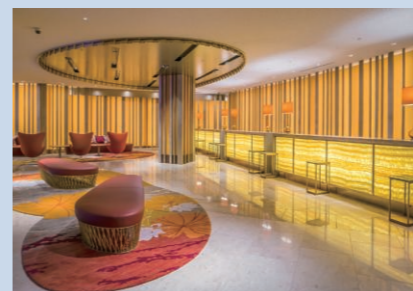
▲フロントレセプション(シェラトン・グランデ・オーシャンリゾート)