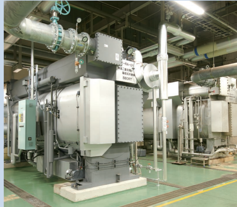
▲蒸気焚吸収冷凍機

2017年10月に開業以来最大規模のリニューアルが完了し、その一環として当社の蒸気焚ナチュラルチラーを更新いただきました。機器の効率向上により蒸気消費量が従来より大幅に削減したため、ガス焼きボイラーの燃料であるガス消費量も低減し、省エネルギー・省コストに貢献しています。