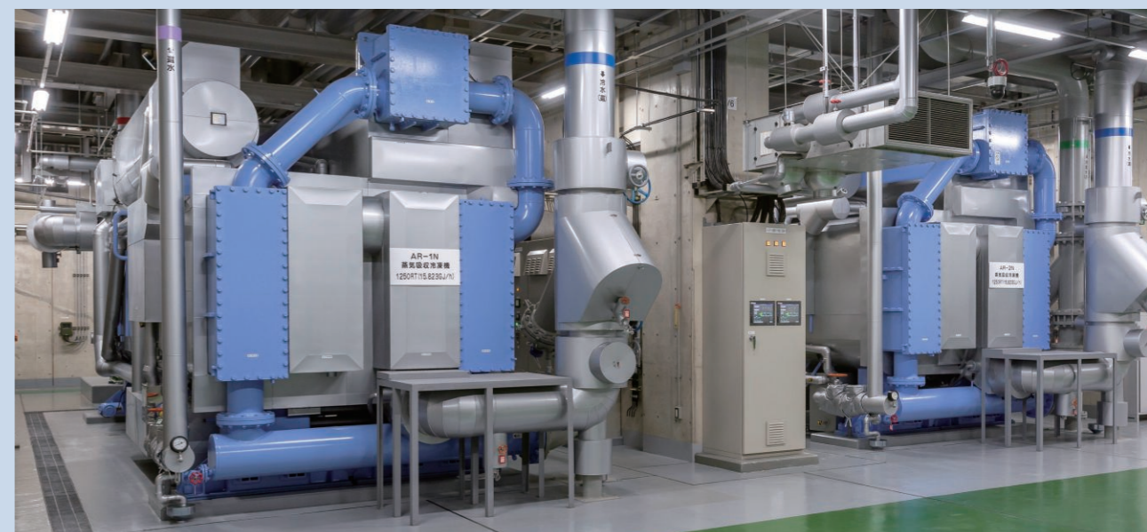
▲蒸気二重効用吸収冷凍機

都市エネルギーの平準化と高効率・省エネルギー運転に貢献するガス・電気併用のベストミックスシステムの一部として、当社の蒸気二重効用吸収冷凍機をご採用いただきました。